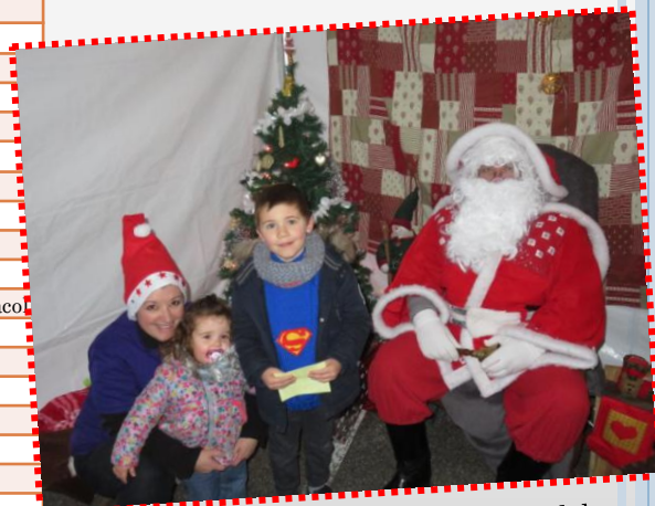
07 Déc : les Illuminations et le Père Noël du Comité des Fêtes