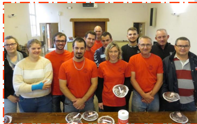
22 Oct : le boudin des Pompiers