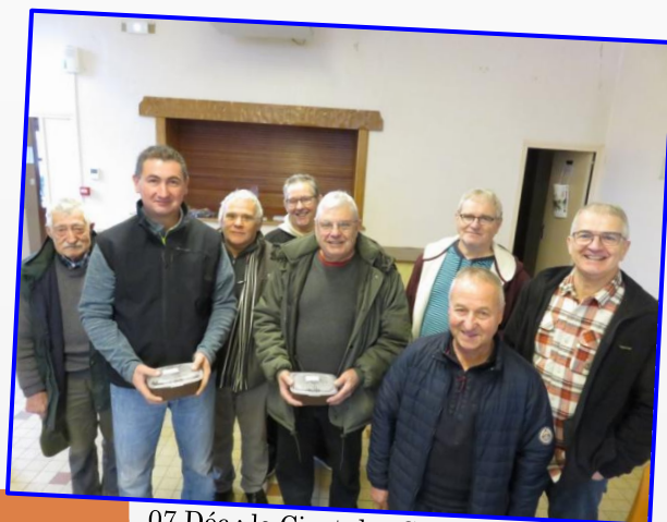
07 Déc : le Civet des Chasseurs