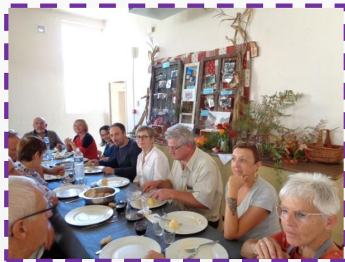
13 Oct : P'tit Patrimoine en Fête