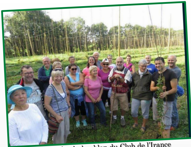
16 Sept : marche du houblon du Club de l'Irance