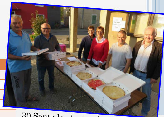
30 Sept : les tartes du Comité