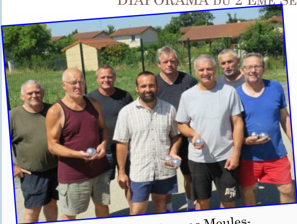
07 Juillet : Pétanque et repas Moules-Frites des Chasseurs