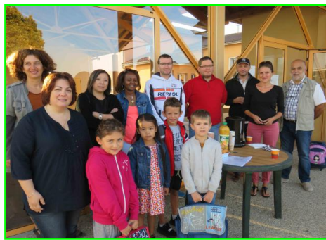
03 Sept : le café de la rentrée du Sou des Ecoles