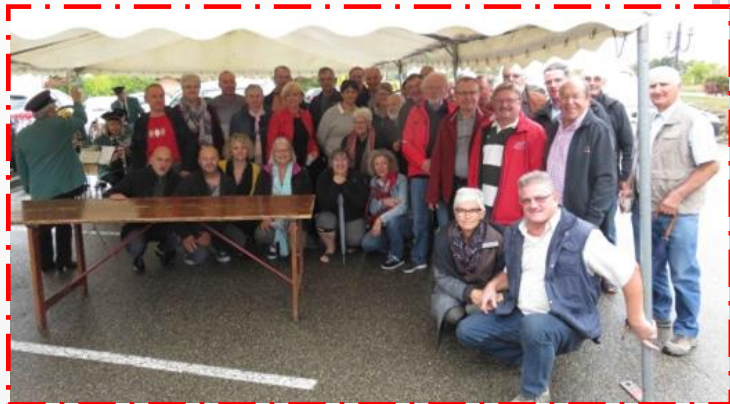
07 Oct : P'tit patrimoine en Fête