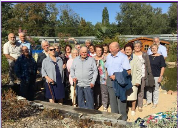
25 Sept : le Club de l'Irance en ballade