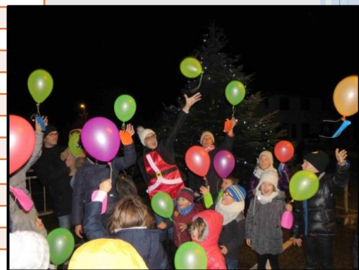
08 Déc : les Illuminations